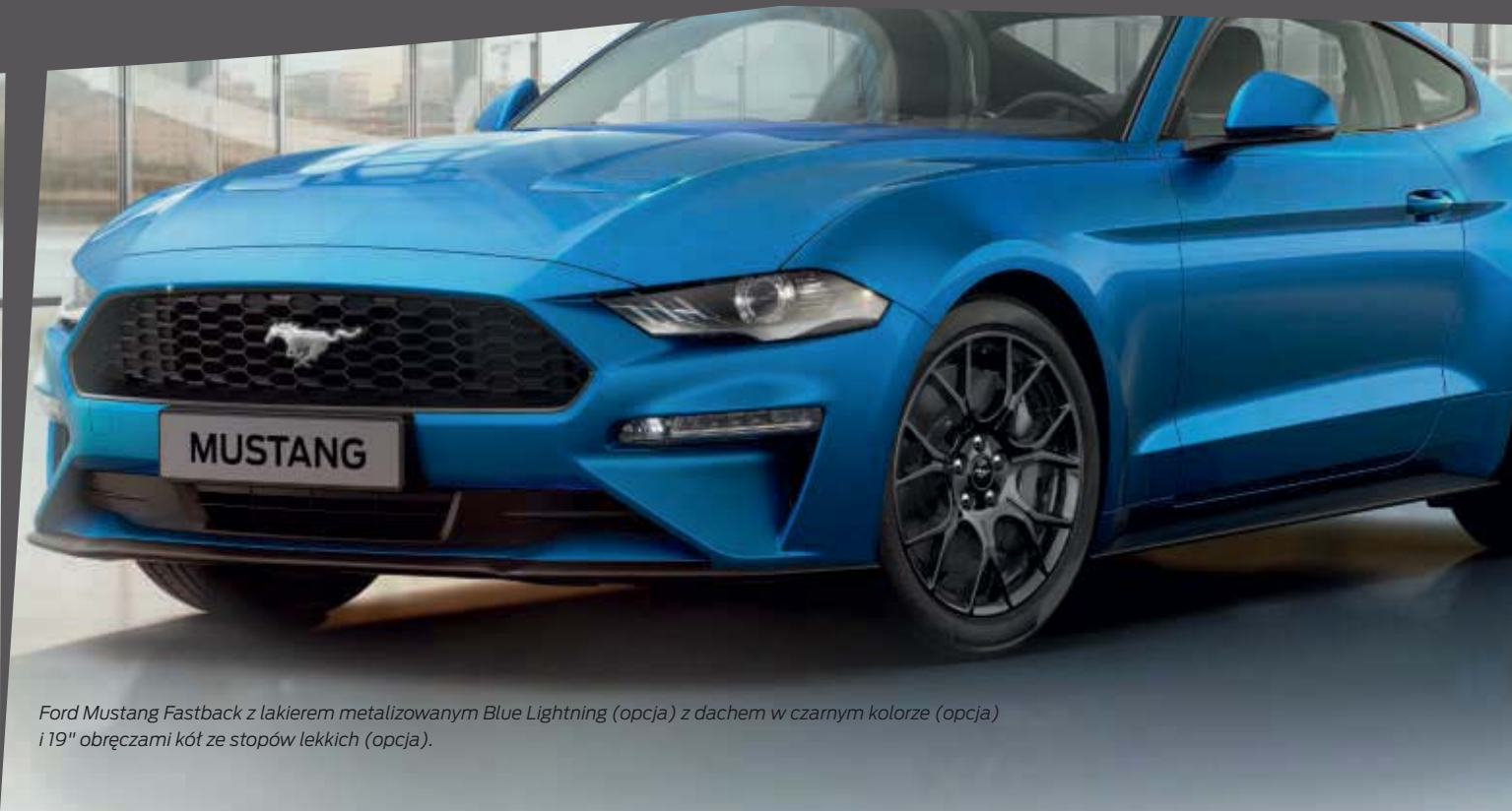
Ford Mustang Fastback z lakierem metalizowanym Blue Lightning (opcja) z dachem w czarnym kolorze (opcja) i 19" obręczami kół ze stopów lekkich (opcja).